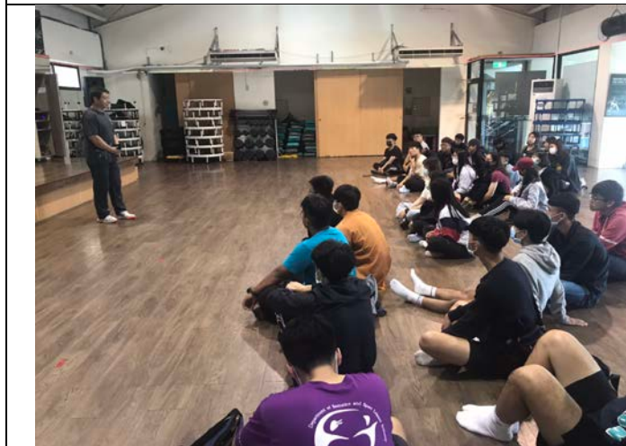
業界老師說明實際經營管理