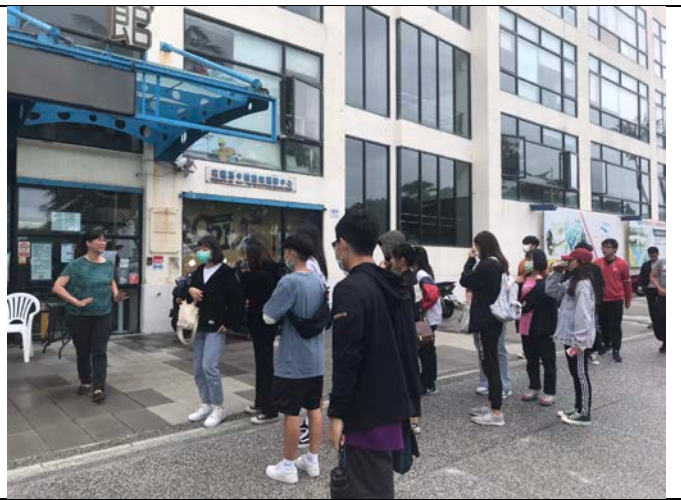
李董事長於會館前歡迎同學並講述亞緻會館目前的現況