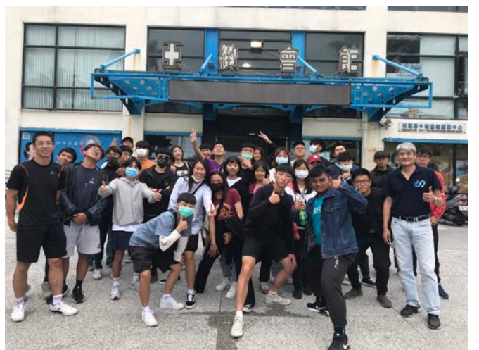
結束參訪於亞緻運動會館合照