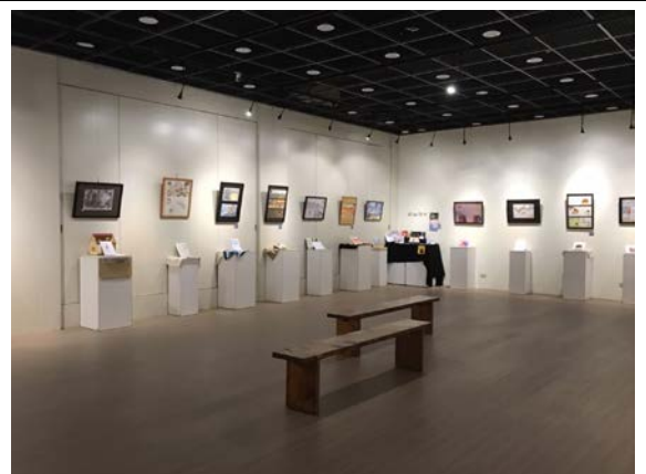
2022/1/6-1/14 期末展覽，臨風藝廊