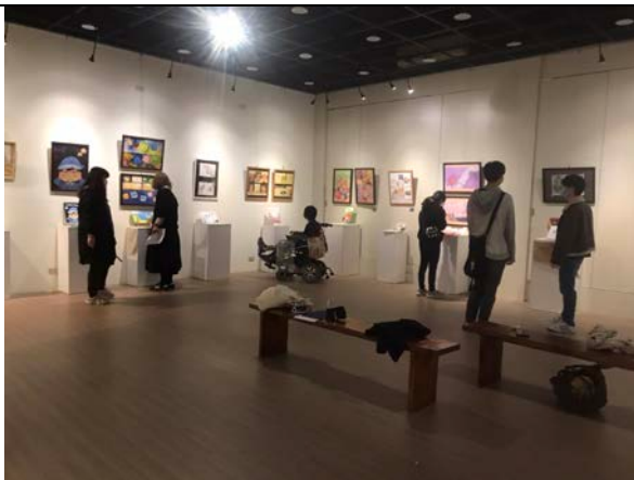
2022/1/6-1/14 期末展覽，臨風藝廊