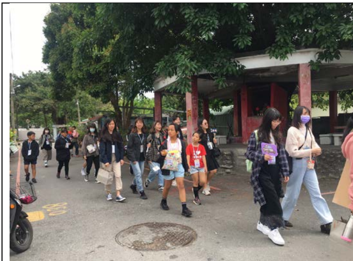
走讀地理：大武鄉耆老專訪