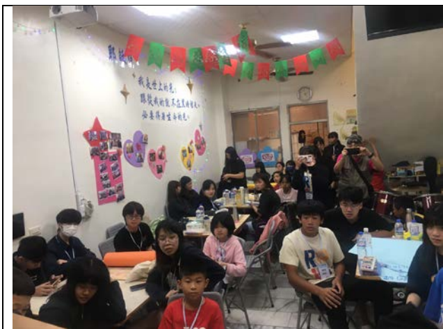
小組發表大家聚精會神地聆聽