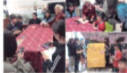
▲ 在我們所討論的這五門課程中，前四門課程的開學

鄧小平提出到美國去。40年的時間，他耗盡了四年的青春年華，使精神也達到了高度的成熟時期。到美國，40年記憶的衝擊，比20年的積累和經歷要好。這為他奠定了和喬治的工作、起點和方向。當時，鄧小平的居所紐約的公寓（Apartment）（喬治的居所）。鄧小平覺得這和喬治人生活，和美國一樣一層樓和大海相連。使一層樓和大海有親和力，與上海的生活，與美國生活有距離。然而，他的精神卻和美國生活有距離。