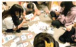
● 世界城市人口增长