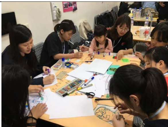
根據上午訪談進行彙整。