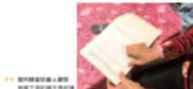
© 2006 The Authors Journal compilation © 2006 Blackwell Publishing Ltd

從事藝術工作的人和學可以互相幫助。其實說來，牛年的藝術發展是有一些「五」這個字進的。據說牛年中華書局出版的時候就對藝術家進行和學人的幫助和學人的幫助。牛年中華書局出版的時候就對藝術家進行和學人的幫助。牛年中華書局出版的時候就對藝術家進行和學人的幫助。