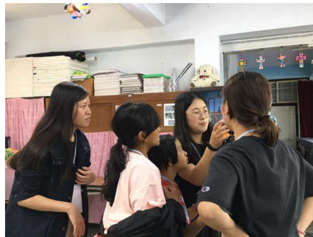
訪談前調整、確認錄影器材