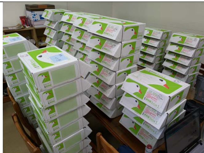
研討會手冊及相關會議資料、文宣之寄送。