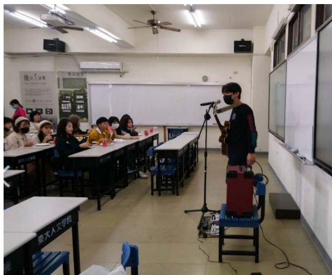
多語詩歌開場演唱