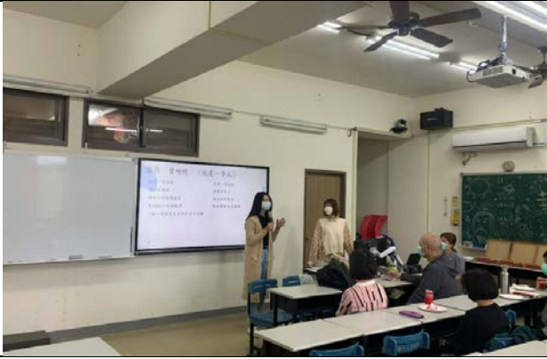
得獎者說明創作緣由