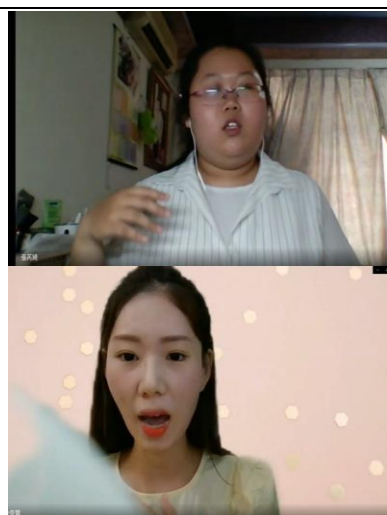
修課學生參與命題演說