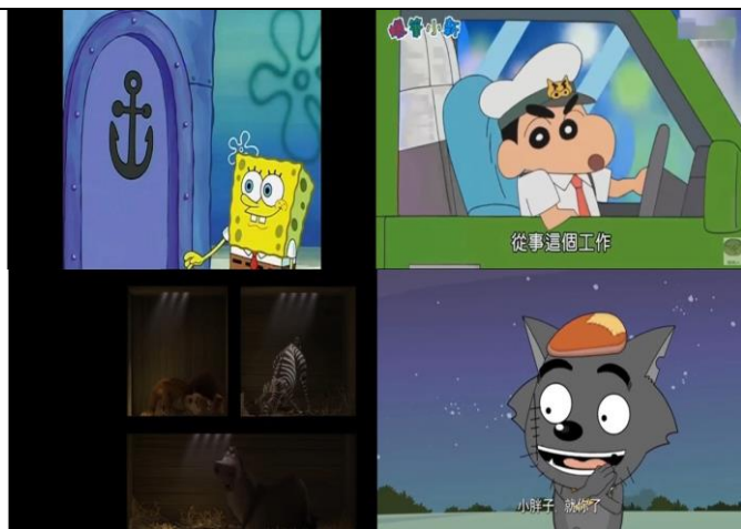
國內外影劇配音大賽(2)