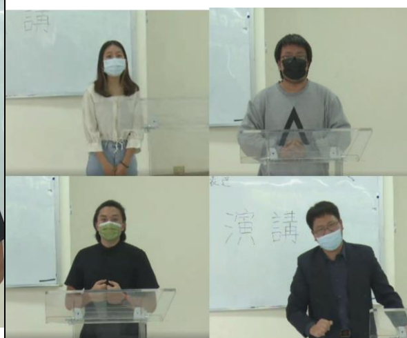
修課學生參與即席演講