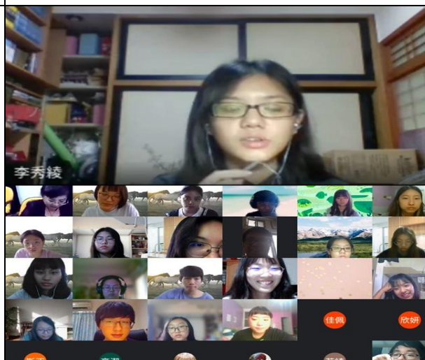
修課同學線上觀摩命題演說