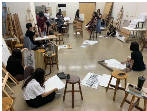
速寫單元第二動繪製準備