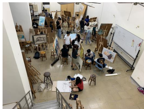
繪製作品中場休息