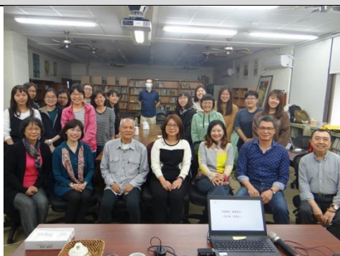
0311 下林文寶－「從現代思潮的演進看幼兒閱讀」